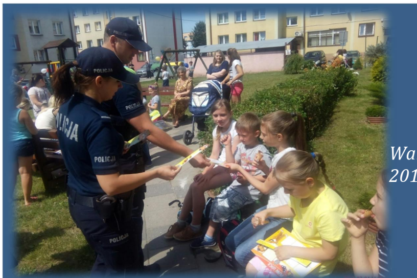
Wakacyjna Akcja Lato 2014 w Mońkach