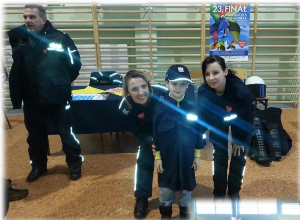
KPP w Mońkach