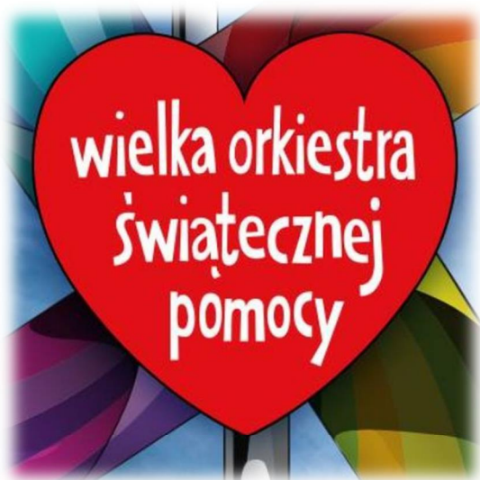
KMP w Białymstoku