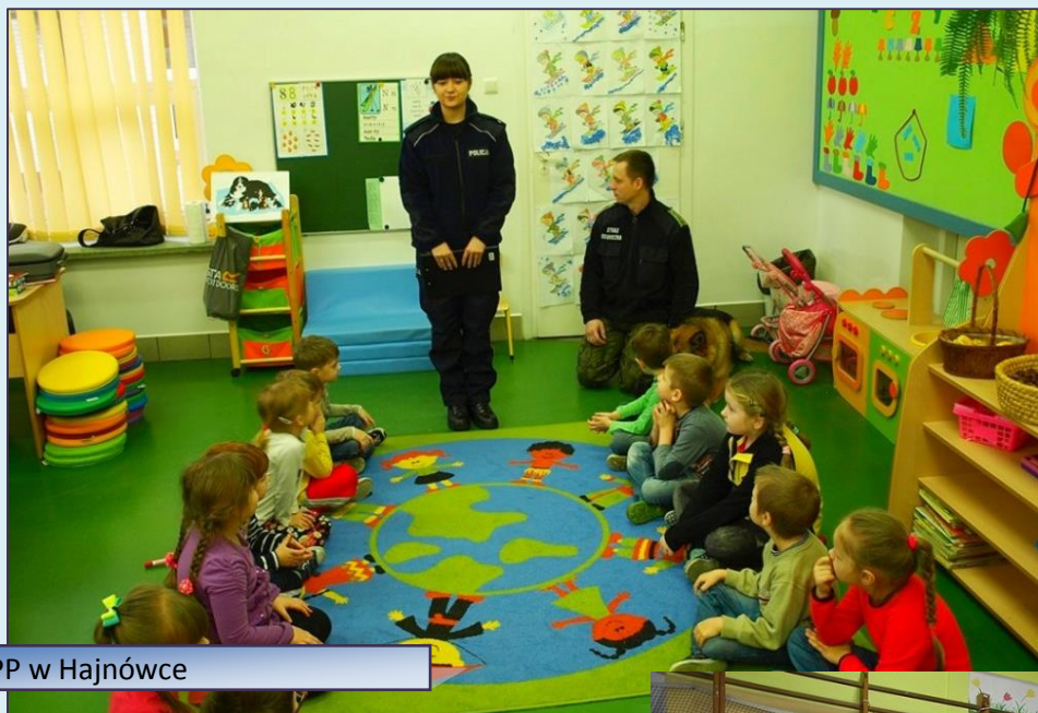
KPP w Hajnówce