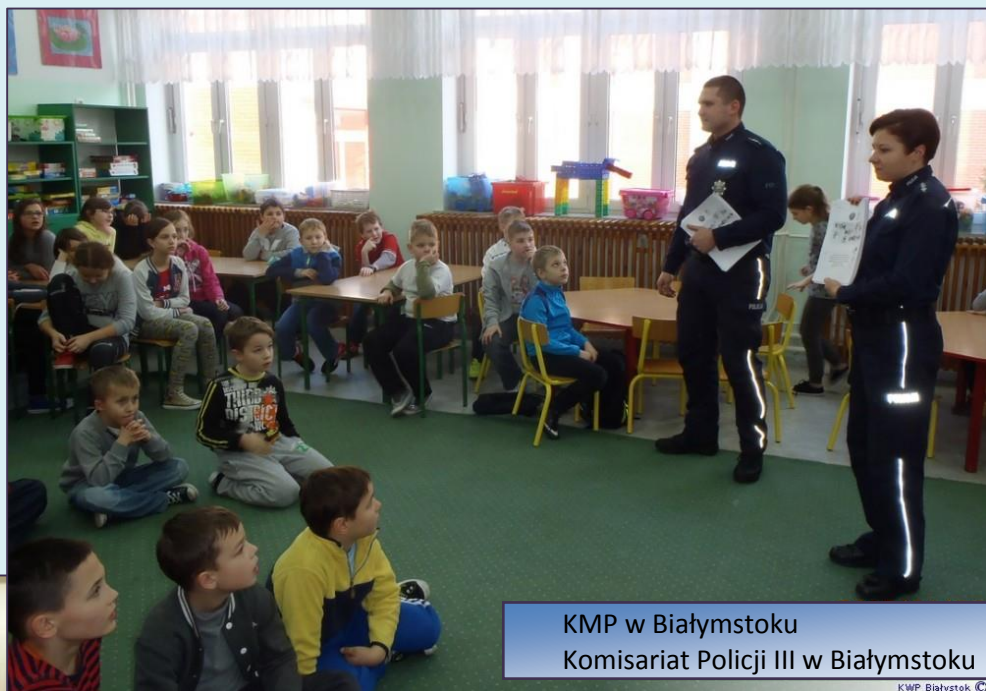
KMP w Białymstoku Komisariat Policji III w Białymstoku

Policjanci garnizonu podlaskiego spotykają się z dziećmi w ramach działań profilaktycznych „Bezpieczne ferie”. Mundurowi podczas spotkań z najmłodszymi poruszają tematy związane z bezpieczeństwem podczas wypoczynku zimowego oraz przypominają zasady ruchu drogowego.