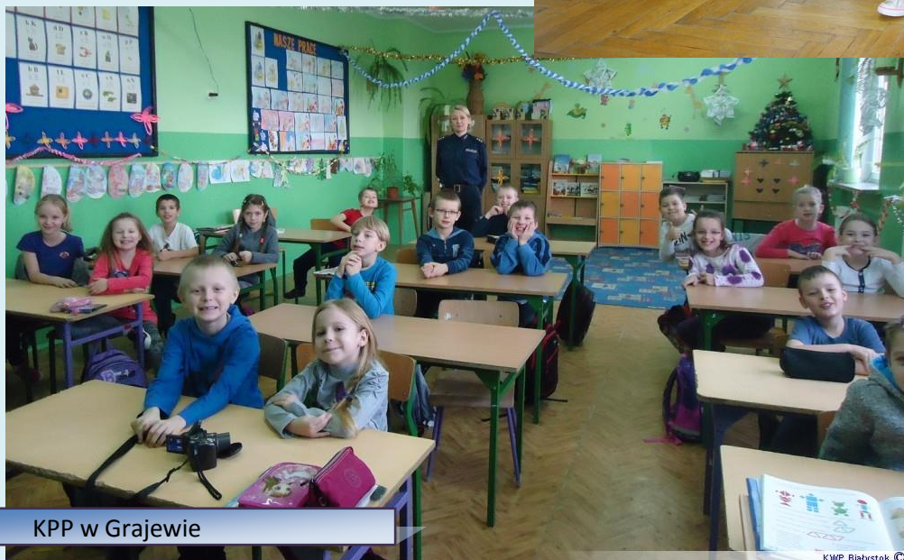
KPP w Grajewie