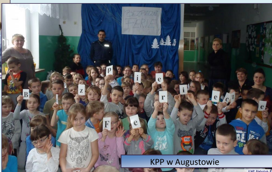
KPP w Augustowie