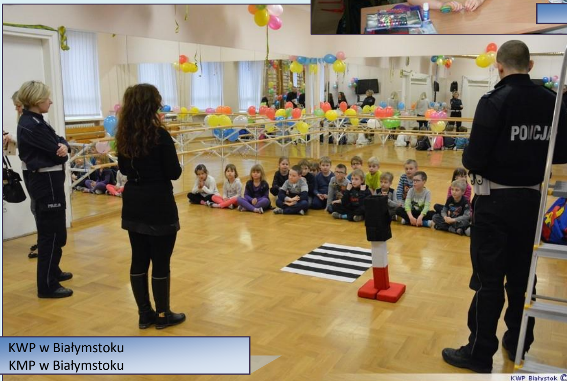
KWP w Białymstoku KMP w Białymstoku