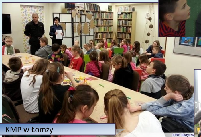
KMP w Łomży