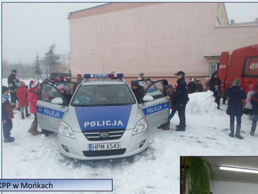
KPP w Mońkach