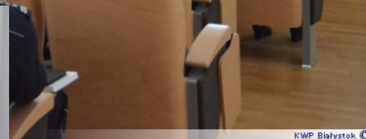
KWP Białystok ©