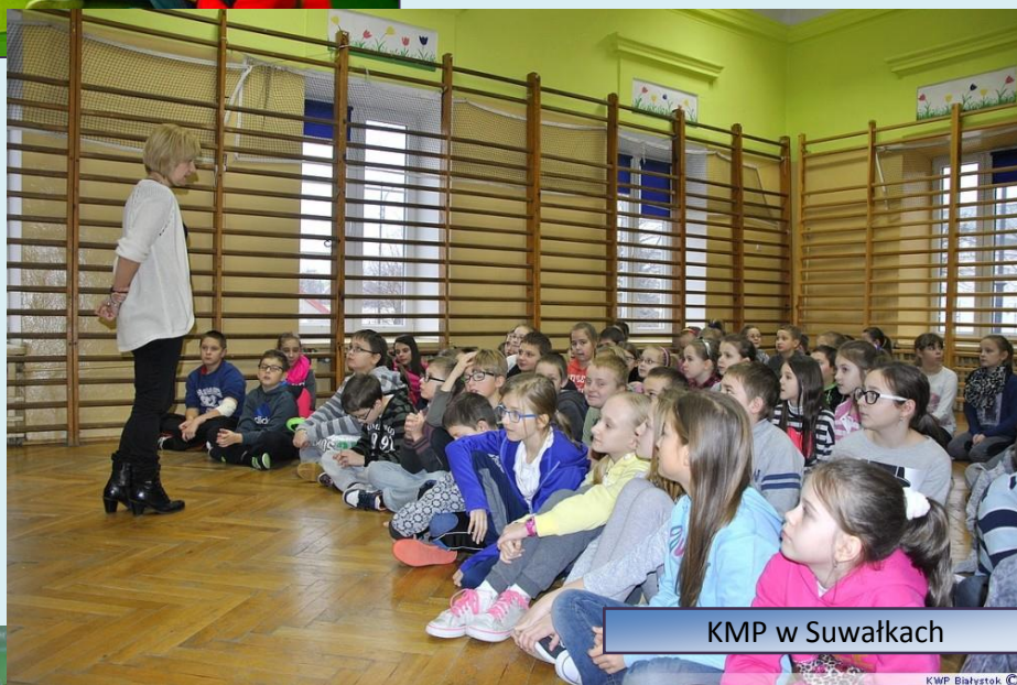
KMP w Suwałkach