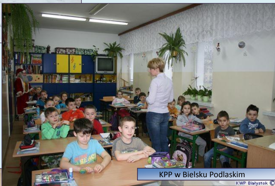
KPP w Bielsku Podlaskim